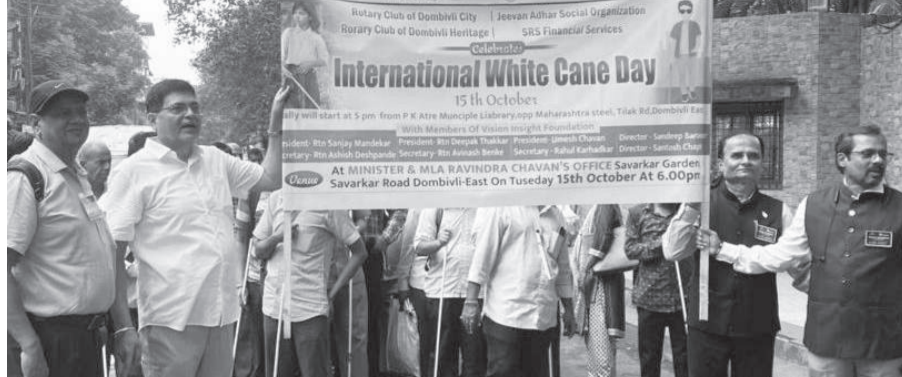
International White Cane Day 15th October