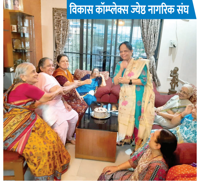
विकास कॉम्प्लेक्स ज्येष्ठ नागरिक संघ