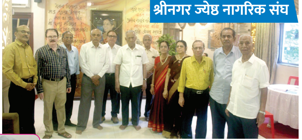
श्रीनगर ज्येष्ठ नागरिक संघ