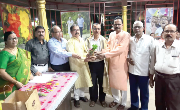
शिवशक्ती ज्येष्ठ नागरिक संस्था